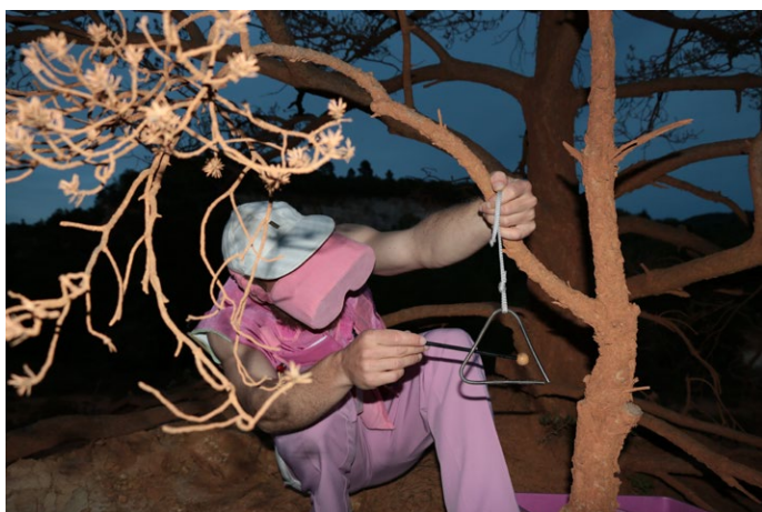
« Veste d'exploration » en action: le son du triangle résonne différemment dans chaque espace.

Pour ces Ateliers et Formules Participatives, la Cie La SECOUSSE a développé une veste d'exploration sonore équipée d'outils afin de découvrir le SON sous différentes approches. Il s'agit d'une exploration sonore et sensorielle de l'espace investit (extérieur ou intérieur).