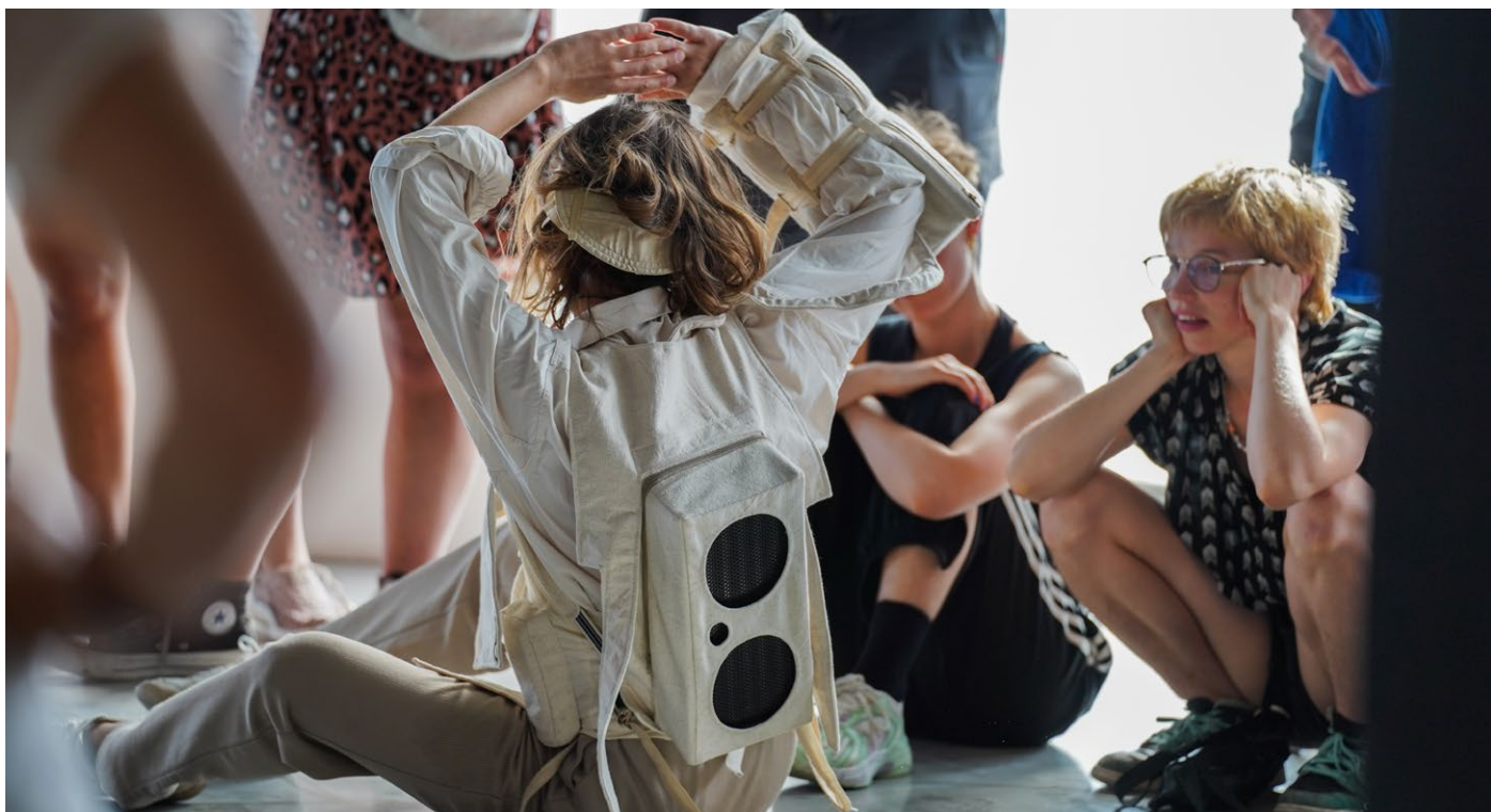
Danse avec le costume des haut-parleurs directionnels dans La Forme Légère.

Des SONS provoqués par le public et les interprètes sont rediffusés en « live » avec un effet de décalage. Pendant une heure, le public assiste et vit la fusion de différentes perceptions sonores immersives.