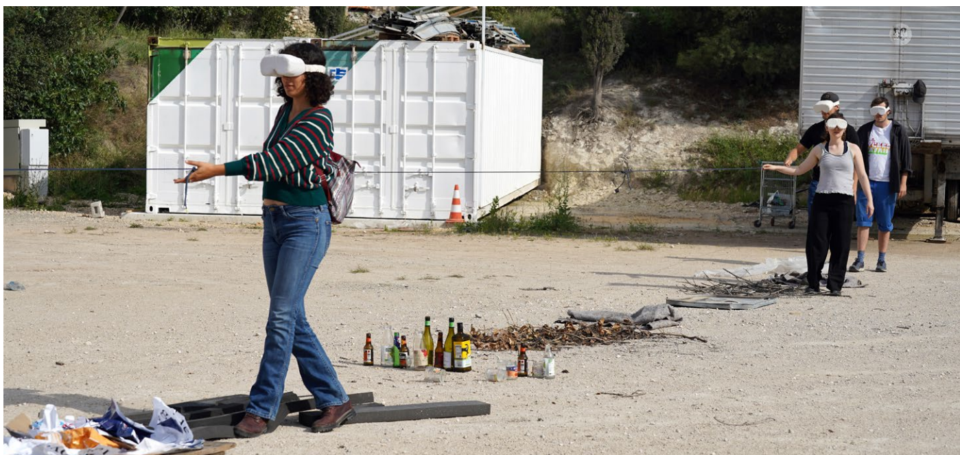
Des participant.e.s portent des lunettes qui obstruent la vue et explorent un espace et ses SONS.