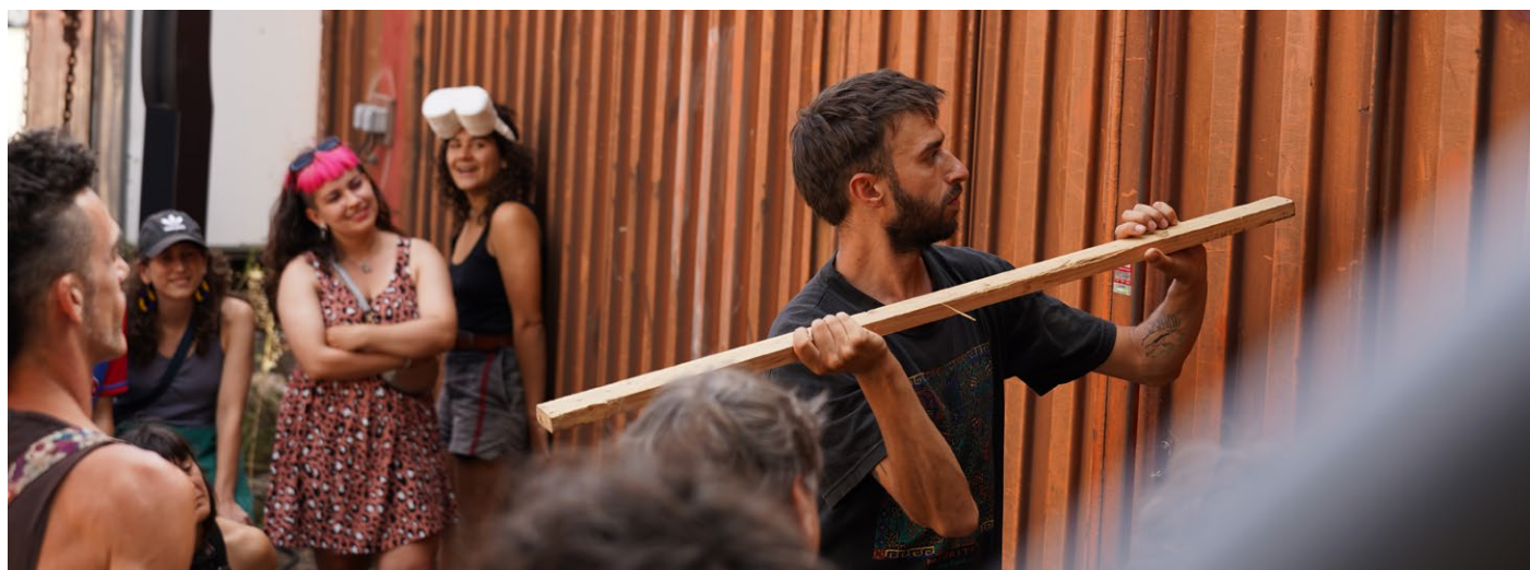
Une esquisse de la performance « Le Ressenti du Son » à La Cité des Arts de la Rue, Marseille, juin 2023.

COMMENT JE PERÇOIS LE SON ? EST-CE QUE JE L'ENTENDS PAR L'OUÏE, PAR MON CORPS ? MON OUÏE FONCTIONNE-T-ELLE DIFFÉREMMENT DE MON CORPS ? AI-JE LA MÊME PERCEPTION QUE LES AUTRES AUDITEURS-SPECTATEURS ?