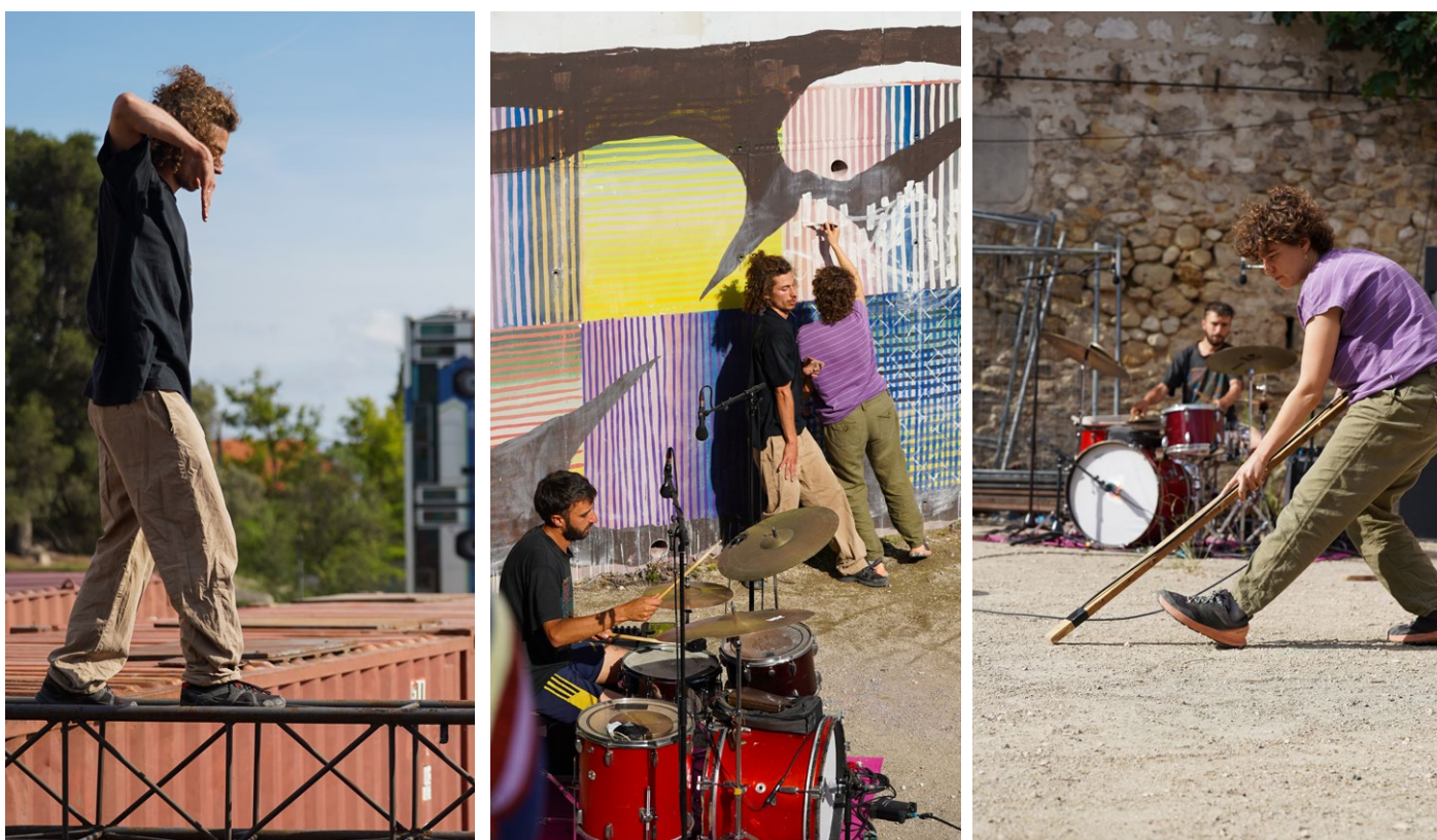
Présentation d'une esquisse du « Ressenti du Son » à La Cité des Arts de la Rue, Marseille, juin 2023.